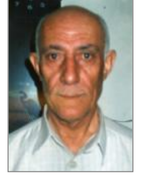
پەيوەندىيەكانى خۆى دەكات.

ەت شىسىپروانى كىسەخاوەنى پەيۈەندىيسەكى بەرفراوانسەو زۆر نزيكسى ئسەمىرى قسەترەو لەسسانى ١٩٩٥ لەگسەن معهممهر قهزافي دانيشتووه. لهسهرهتاي سالهكانى هههفتاكان پهيوهندى لهكهل مددام و براكانيداً دروستكردووهو تى سىهددام بووه تاوهكو رايمرين. رەفعەت شىڭروانى لەھەقپەيقىنىكدا لەڭھال