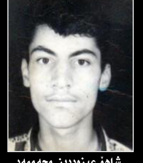
شاهو عيز مددين محه ممهد